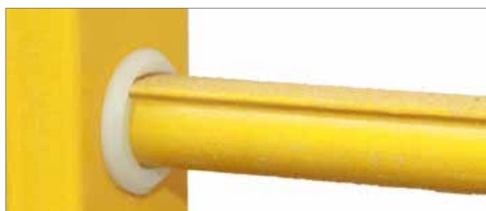
Comfort laddersport met plat stavlak en anti-slip afwerking